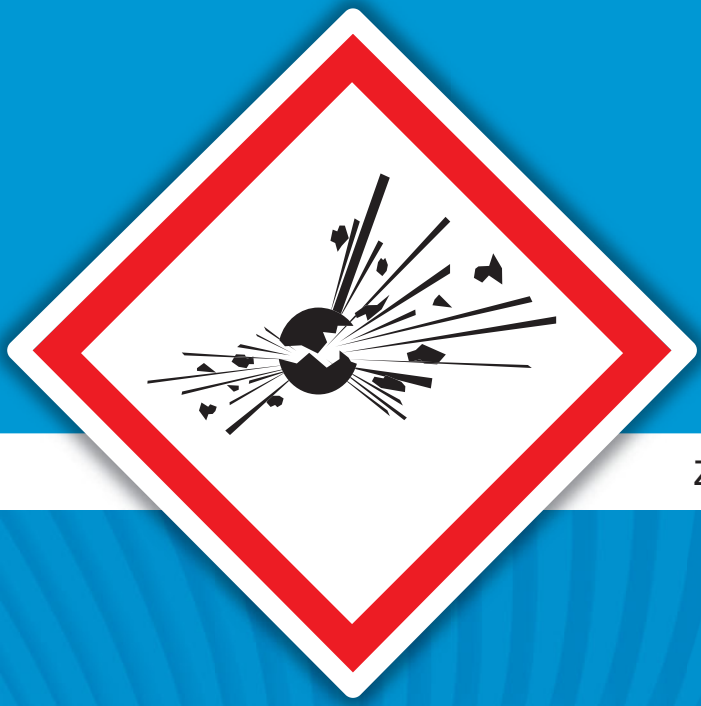
Zeichen GHS01: Explodierende Bombe